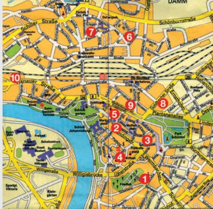
1. JUKUZ / Cafe ABdate, 2. vhs-Haus, 3. Casino Kino, 4. Rathaus, 5. Martinushaus, 6. St. Josef, 7. Pestalozzistr., 8. City-Galerie, 9. Frohnsinnstr., 10. Hanauer Straße